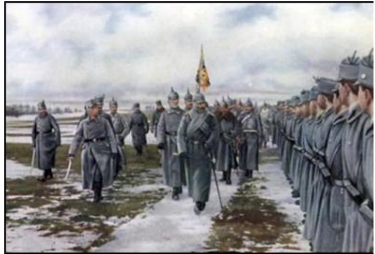
Tyske kejsaren Wilhelm II - som fått bära stort ansvar för kriget – inspekterar sina trupper. (Bild: Great War Primary Document Archive: Photos of the Great War -www.gwpda.org/photos).

Efter det tyska enandet 1871 blev Tyskland allt starkare samtidigt som det Osmanska riket i sydöstra Europa blev allt svagare. Detta skapade en obalans i storpolitiken. I både Frankrike och Storbritannien oroade man sig för den tyska makttillväxten. På Balkanhalvön ('Europas oroliga hörn'), backade Tyskland upp Österrike-Ungern medan Ryssland stödde det lilla Serbien.